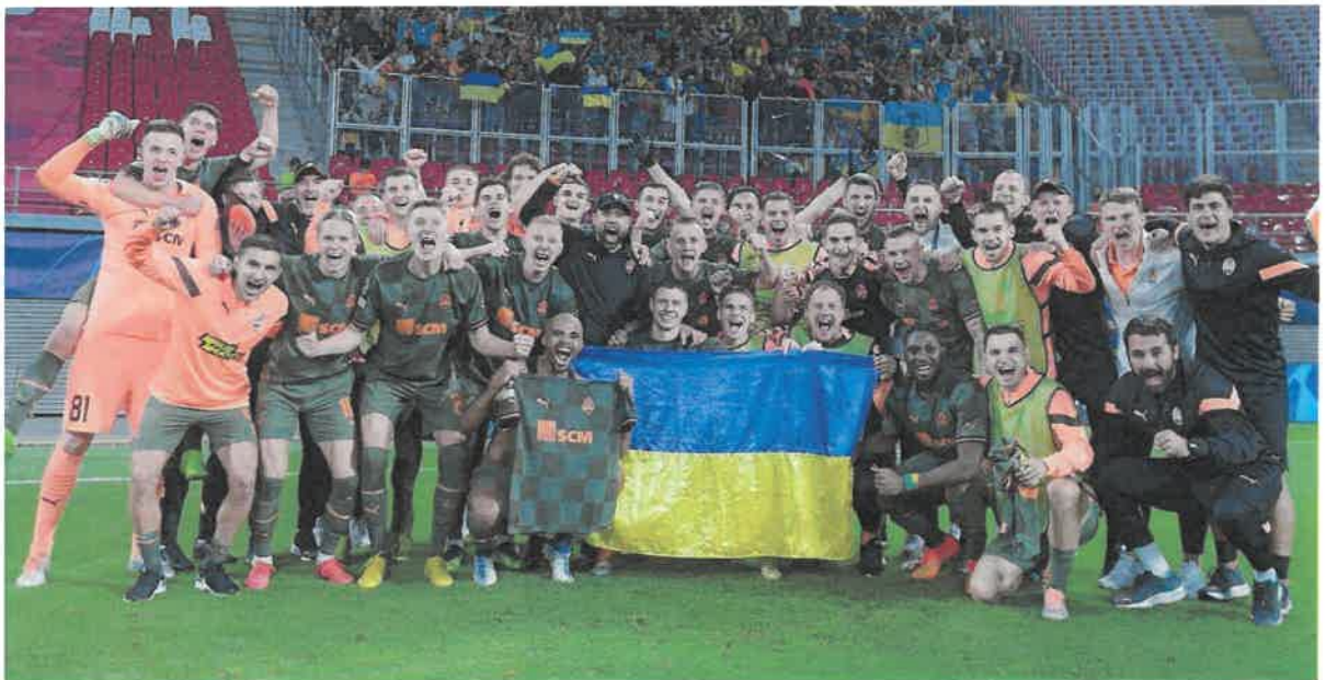
Ліга чемпіонів УЄФА – 2022/23. «Лейпциг» – «Шахтар» – 1:4