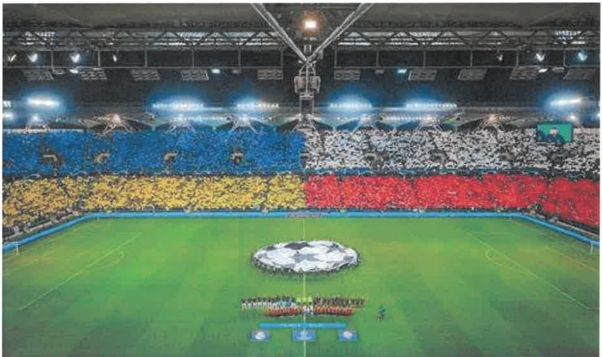
Підтримка вболівальників на матчі Ліги чемпіонів УЄФА «Шахтар» – «Реал» у Варшаві

24 лютого 2022 року Російська Федерація розпочала повномасштабну війну проти України. Тренувальна база ФК «Шахтар» у Святошині потрапила під обстріл. Один зі снарядів поцілів у тренувальне поле, ще один – у приміщення з екіпуванням. У квітні вибухотехніки ДСНС розмінували дороги, що ведуть до території комплексу «Святошин», і відновили доступ до інфраструктури. Проте ФК «Шахтар» був змушений залишити Київ через воєнні дії країни-агресора і тимчасово проводити домашні єврокубкові матчі у Варшаві (Польща). Міський стадіон «Легія» імені маршала Юзефа Пілсудського став сьомою ареною, де команда вимушено приймала суперників у єврокубках сезону-2022/23.