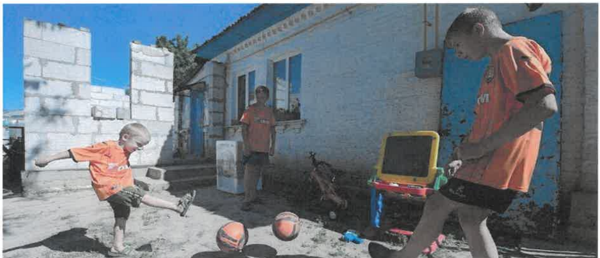
Shakhtar Social і Shift360 допомагають українським дітям

Співпраця з EFDN (European Football for Development Network) та європейськими футбольними клубами дозволила Shakhtar Social організувати доставку гуманітарних вантажів загальною вагою 34 тонни, а також реалізувати програму European Football Powers Up Ukraine зі збору генераторів для України.