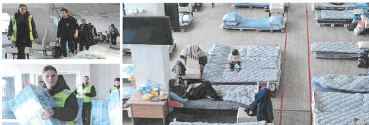
Shelter Centre «Шахтаря» на «Арені Львів»

Shelter Centre за підтримки ФК «Шахтар» було відкрито 9 квітня 2022 року на «Арені Львів». Відтоді гуманітарний центр прийняв уже 1 200 переселенців з різних областей країни: Донецької, Луганської, Харківської, Миколаївської, Запорізької, Херсонської, Дніпропетровської, Чернігівської та Київської. Постійно тут проживають понад 200 осіб, переважно жінки й діти. Найстаршому гостеві Shelter Centre виповнилося 86 років, наймолодшому – лише 4 дні.