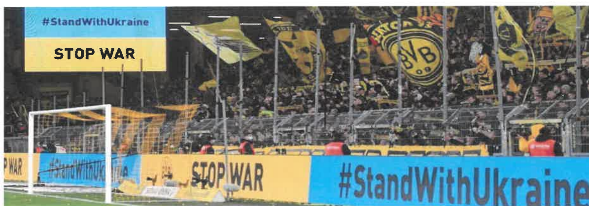
«Боруссія» (Дортмунд) – «Лейпциг». Квітень 2022 року

Обурлива реакція європейської та світової футбольної спільноти на розв'язану проти України війну втілювалась не лише у словах, а й у дії. У багатьох матчах команди з'являлися на полі з банерами Stop War і Peace For Ukraine, а на трибунах можна було помітити чимало синьо-жовтих прапорів.