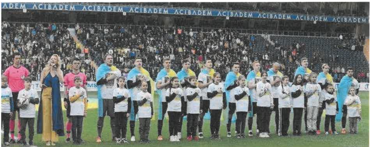
Благодійний матч у межах Shakhtar Global Tour for Peace

На початку квітня 2022 року ФК «Шахтар» започаткував серію благодійних матчів під патронатом МЗС України та за підтримки партнера клубу компанії SkyUp Airlines. Усі кошти від реалізації квитків на ігри та реклами було передано волонтерським організаціям, медикам, а також спрямовано на допомогу українським дітям, які постраждали від війни. Таким чином, ФК «Шахтар» залучив 44 мільйони гривень для допомоги Україні.