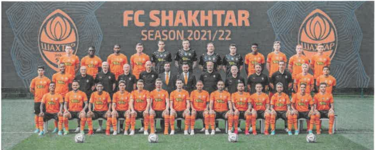
Склад ФК «Шахтар» сезону-2021/22